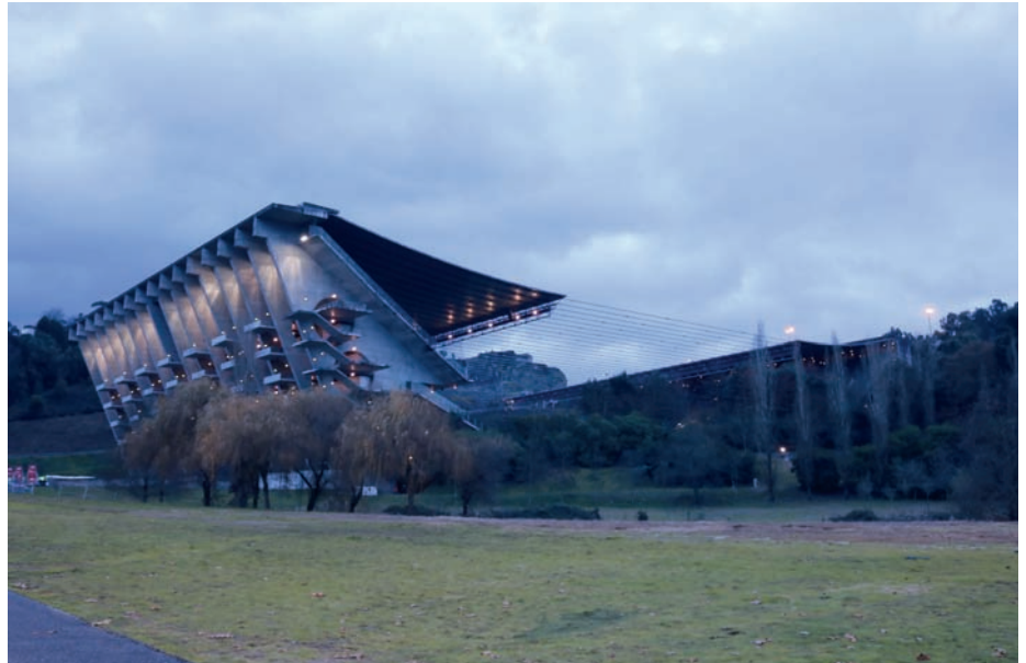
Estádio de Futebol da Cidade de Braga

Através do seu efectivo, este Comando vai continuar a garantir a segurança, no sentido de melhor prevenir e reprimir todas as manifestações de violência associadas ao desporto.