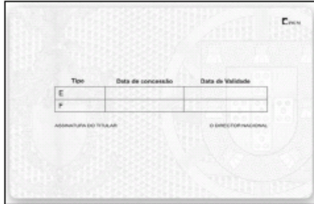
Cartão em policarbonato, formato ID1 (ISO/ IEC 7810:2003 identification cards – physical characteristics) com design gráfico de segurança

O anexo II tem redacção da Portaria n.º 1165/2007, de 13-9.